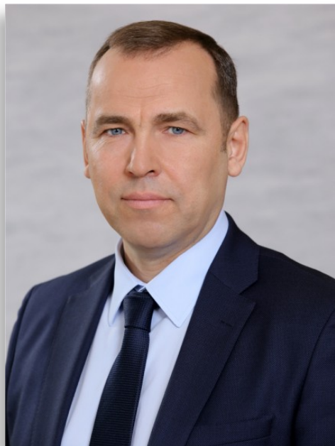
Губернатор Курганской области Шумков Вадим Михайлович

Привлечение инвестиций в Курганскую область и реализация крупнейших инвестиционных проектов способствует достижению национальной цели развития — увеличению реального роста инвестиций в основной капитал на 70 % до 2030 года по сравнению с 2020 годом.