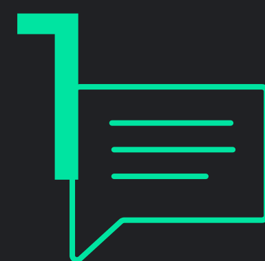
СХЕМА РАССМОТРЕНИЯ «ПРЯМЫХ ОБРАЩЕНИЙ» ИНВЕСТОРОВ, ПОСТУПАЮЩИХ В ЭЛЕКТРОННОЙ ФОРМЕ ЧЕРЕЗ КАНАЛ ПРЯМОЙ СВЯЗИ В ИНФОРМАЦИОННО-ТЕЛЕКОММУНИКАЦИОННОЙ СЕТИ ИНТЕРНЕТ

НАПРАВЛЕНИЕ ОБРАЩЕНИЯ ПО ВОПРОСАМ ОСУЩЕСТВЛЕНИЯ ИНВЕСТИЦИОННОЙ ДЕЯТЕЛЬНОСТИ ЧЕРЕЗ «ЛИНИЮ ПРЯМЫХ ОБРАЩЕНИЙ» НА ИНВЕСТИЦИОННОМ ПОРТАЛЕ КУРГАНСКОЙ ОБЛАСТИ INVEST45.RU