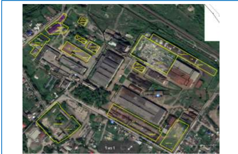
Курганская область, Катайский МО, г. Катайск, ул. Матросова, д. 1 (Индустриальный парк «Катайск»)